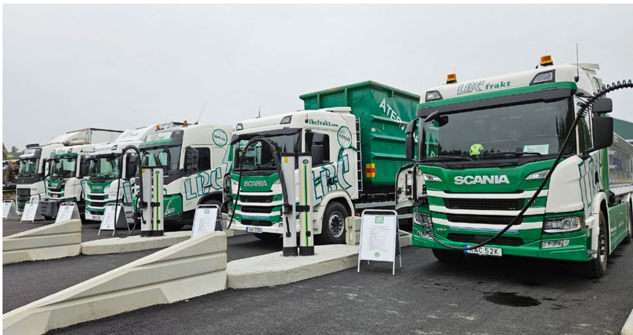
Vid laddparken i Bråtebäcken i Karlstad finns snabbaddare för tunga transporter.