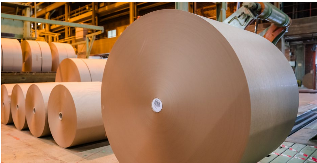
Nordic Paper har tre av sina fem pappersbruk i Värmland.