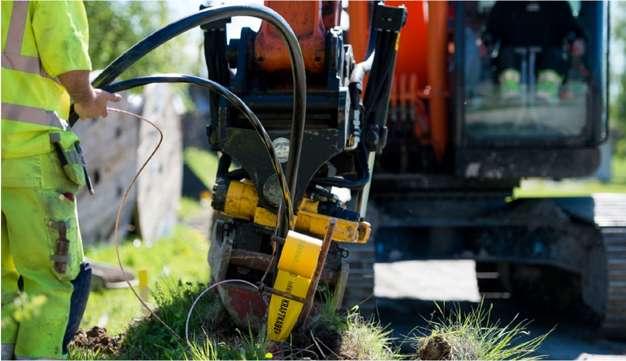
För att vädersäkra elnätet har Ellevio grävt ner runt 8 000 kilometer kabel.