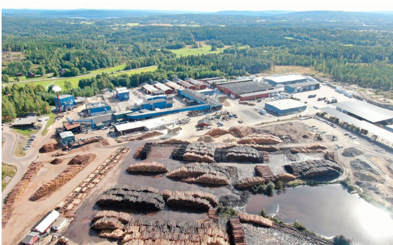
Spån och bark används för egen energiproduktion i värmepannan vid anläggningen i Korterud.