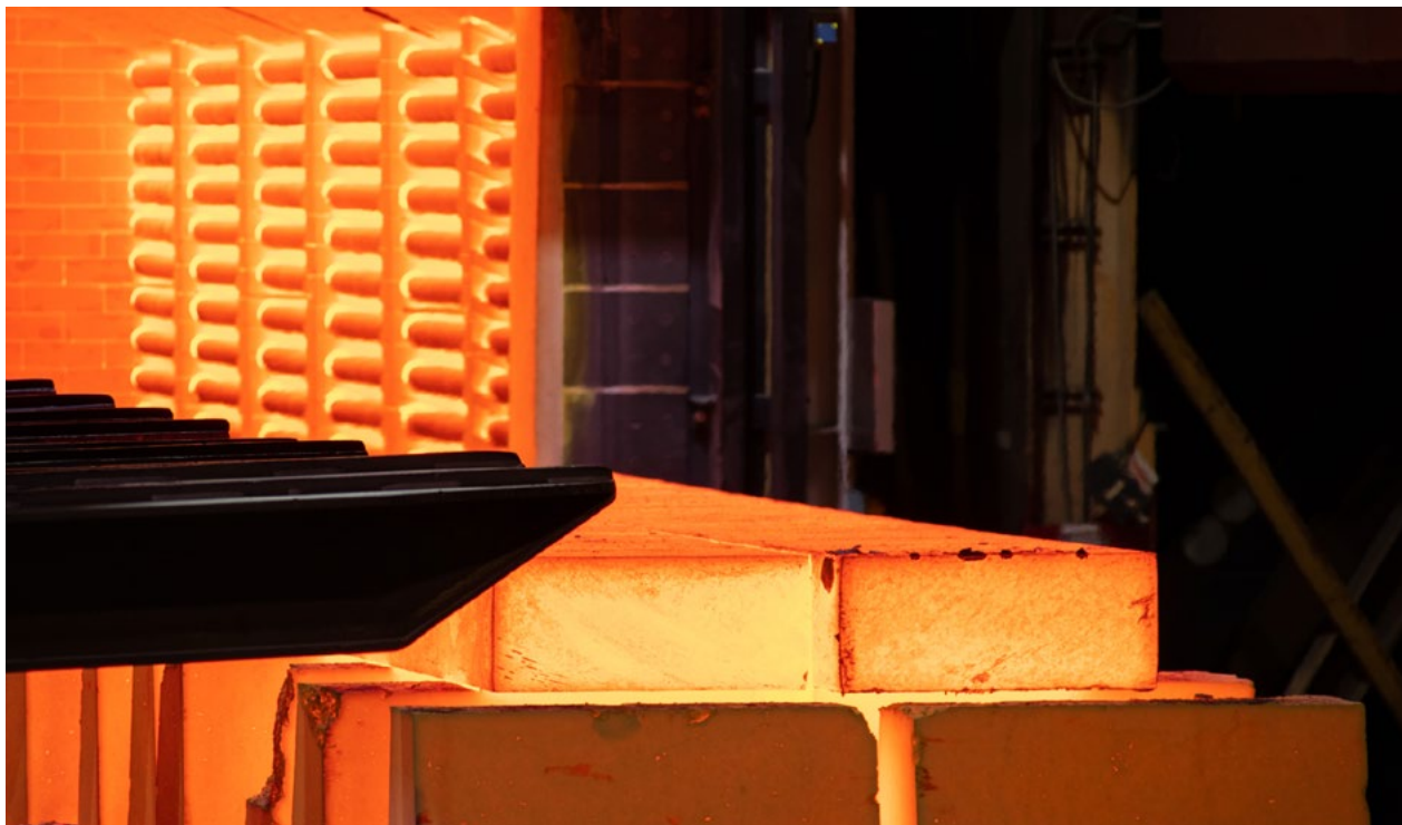
Vid stålproduktion krävs temperaturer på långt över 1 000 grader.