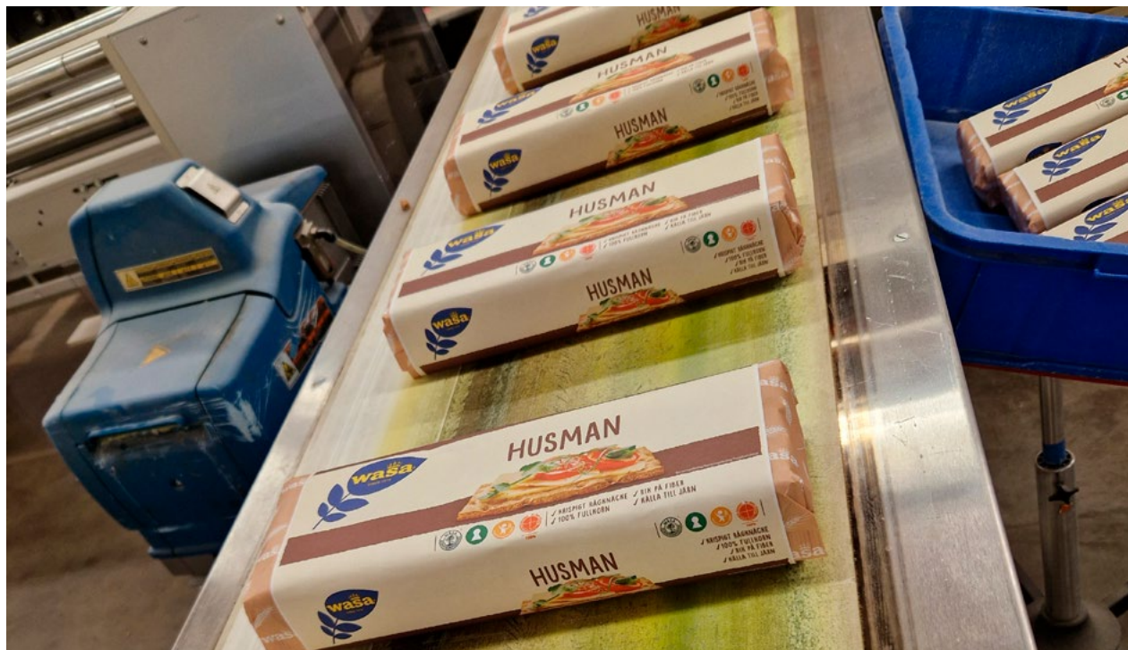
Barillas fabrik i Filipstad producerar runt 300 000 knäckebrödspaket per dygn.