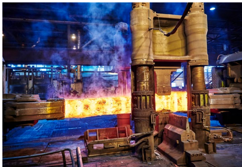
Götvalsverket i Hagfors.