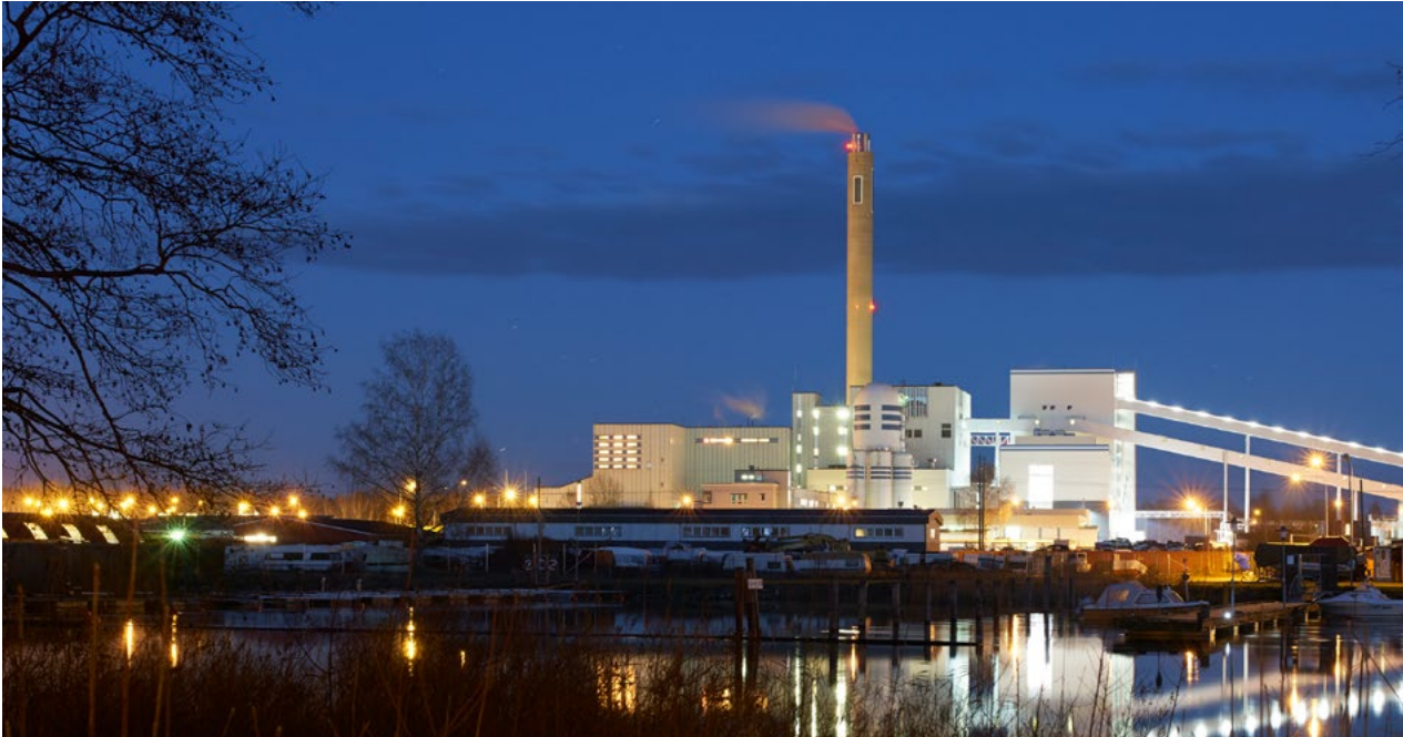
Kraftvärmeverket på Heden i Karlstad.