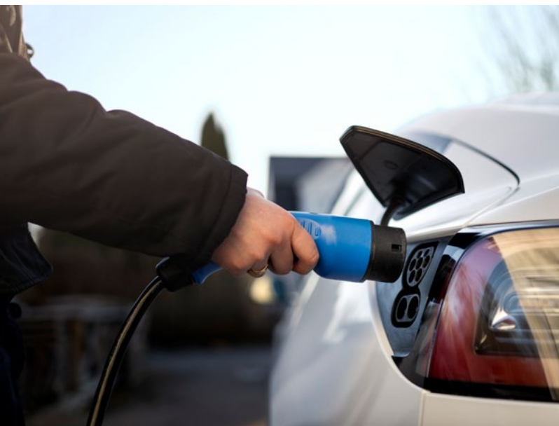
Det behövs fler laddstationer till elbilar, vilket ökar kraven på de lokala elnäten.