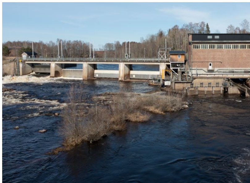
En stor del av den värmländska elen kommer från vattenkraft, bland annat Fortums kraftverk i Forshaga.