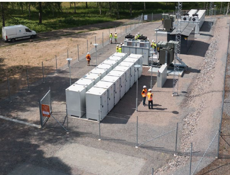
I Grums finns ett av Ellevios batterilager, som ska bidra till balansen i elsystemet genom att det snabbt går att ladda upp eller ladda ur, beroende på behov.