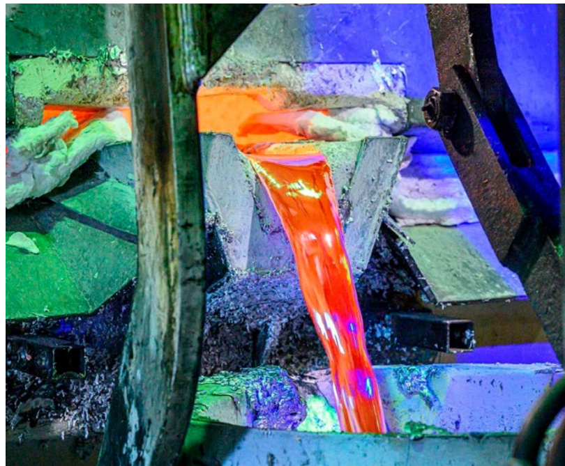
Smält aluminium töms ur smältugnen.