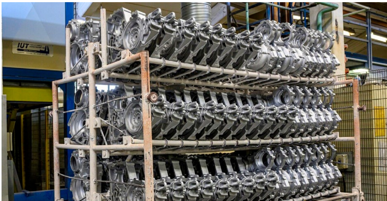
Fundo gjuter och bearbetar detaljer i aluminium vid fabriken i Charlottenberg.